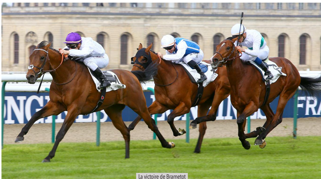
La victoire de Brametot

Maisons-Laffitte a la particularité de ne pas délivrer de temps partiels. Les courses en ligne droite se disputent de surcroît côté tribunes, donc sans les repères habituels pour marquer les distances. La seule possibilité à notre disposition pour évaluer les chronos est de se baser sur la Girafe, située d'après Google Earth à 350m du poteau d'arrivée... Encore faut-il que le cadrage vidéo le permette !