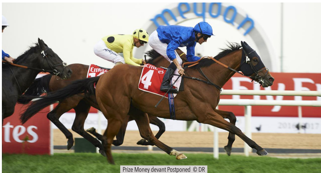
Prize Money devant Postponed

Le 4 mars dernier s'est tenue la réunion du Super Saturday à Meydan, sorte de répétition générale de celle de la Dubai World Cup, le 25 mars. Habituellement, les différents Groupes nous donnent des indications précieuses en vue des grands rendez-vous de la fin du mois. Cette année pourtant, l'analyse des résultats nous apprend qu'il est peu probable que l'on y ait vu les futurs gagnants du Dubai Sheema Classic, du Dubai Turf, ou de la Dubai World Cup.