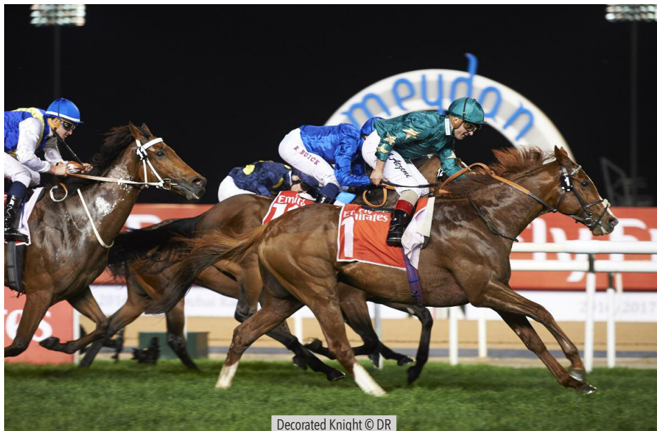
Decorated Knight

La plus belle de Decorated Knight. C'est dans les derniers mètres que Decorated Knight (Galileo) est venu prendre l'avantage sur un très résistant Folkswood (Exceed and Excel) pour s'imposer de peu dans le Jebbel Hata (Gr1), en 1'49"96. Là encore, sa performance ne restera pas dans les annales de cette course. Le record de l'épreuve est détenu depuis 2010 par Hunter's Light (Dubawi) en 1'47"97. Il en est donc loin, et encore plus quand on considère le record de la piste, détenu par Just A Way (Heart's Cry) dans le Dubai Turf 2014, en 1'45"52. Malgré une bonne accélération dans les 600 derniers mètres, en 33"86, son sectionnal rating le situe 10 longueurs en dessous de Just a Way ou encore 8 longueurs en dessous de Solow (Singspiel). Pour espérer décrocher le Graal, il faudra boucler les 1.800m de la piste en turf en moins de 1'47"50. Sajjhaa (King's Best) est pour le moment la seule à avoir réussi le doublé Jebbel Hata & Dubai Turf. Au mieux, Decorated Knight peut espérer une place dans le Gr1 du 25 mars.