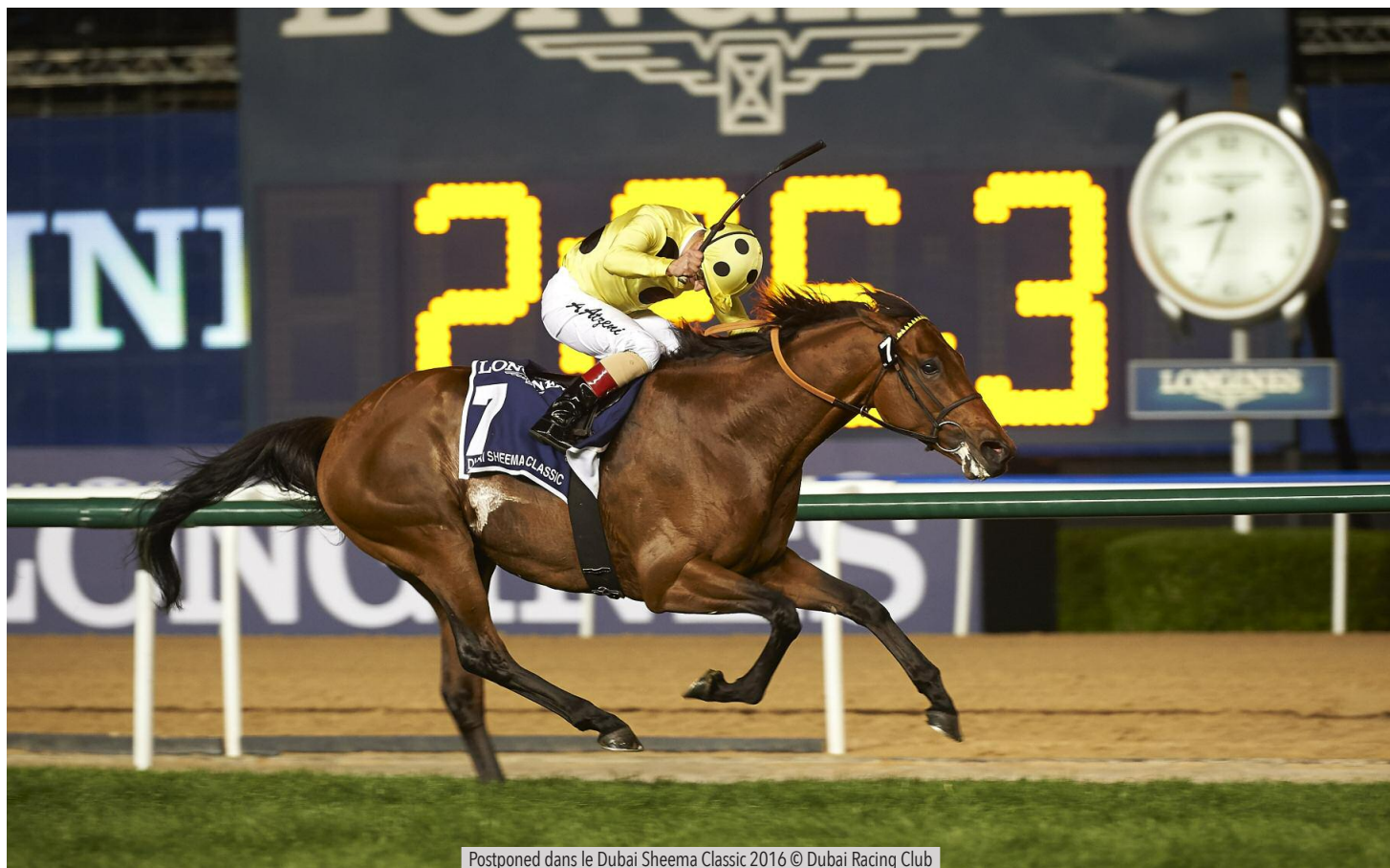
Postponed dans le Dubai Sheema Classic 2016