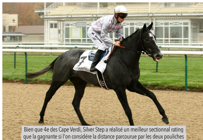
Bien que 4e des Cape Verdi, Silver Step a réalisé un meilleur sectionnal rating que la gagnante si l'on considère la distance parcourue par les deux pouliches

Les ratings donnent Silverstep une longueur devant Very Special. Malgré le changement de distance, elle a une chance très sérieuse de la battre dans les Balanchine.