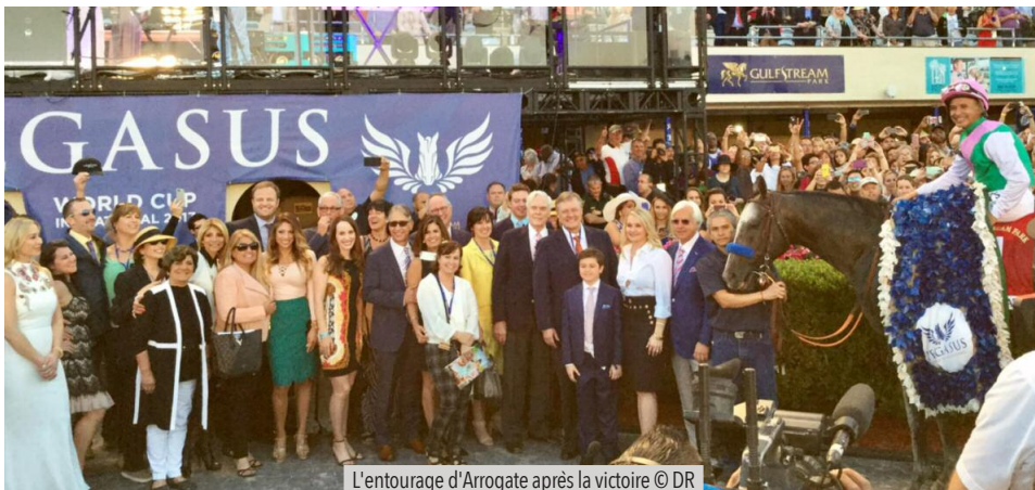
L'entourage d'Arrogate après la victoire

Les 200 derniers mètres ont été couverts en 13"71, un temps à mettre en parallèle avec la moyenne de 12"62 des lauréats de Donn Handicap entre 2010 et 2016.