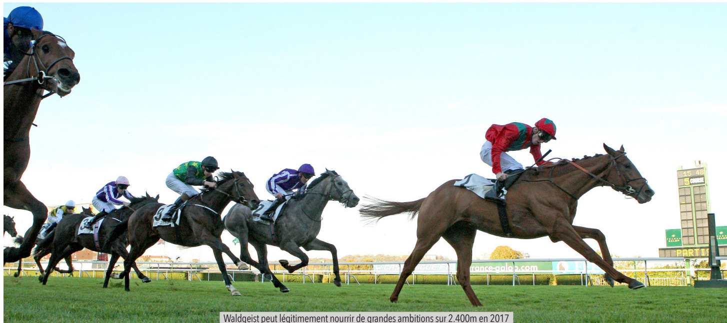
Waldgeist peut légitimement nourrir de grandes ambitions sur 2.400m en 2017